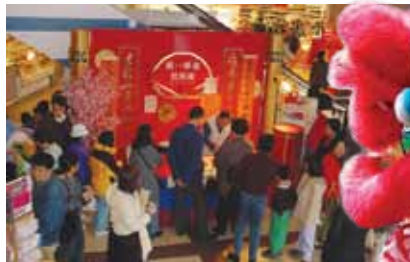
每逢農曆年初一，商場均安排了醒獅賀歲。

樓下的大統華超級市場當然是人所共知提供最方便齊全貨品選擇的亞裔超級市場。連接在超級市場外的燒臘店更為購物人士提供一站式的服務，無論是午餐飯盒或者晚飯加銜等一應俱全。